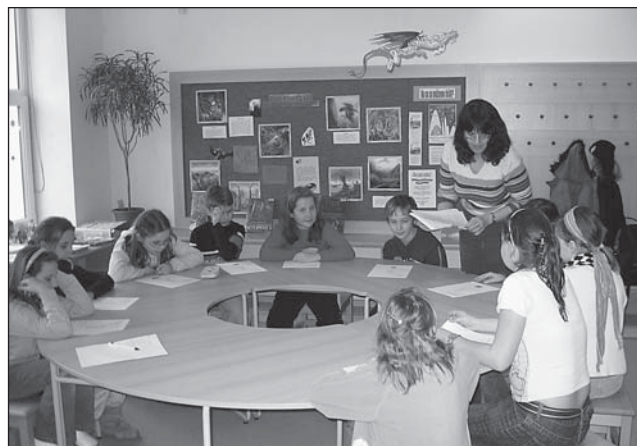
Malí herci, kroužek dramatické výchovy – čtená zkouška divadelního představení „O bílé kočičce“.

hod. „Vánoce u Čapků“ v Čítárně u čerta - zábavné odpoledne plné čtení, vyprávění o vánočních zvycích spojené se zdobení perníků. Všem čtenářům přejeme příjemnou vánoční pohodu a těšíme se na setkání v roce 2009. Pracovnice knihoven